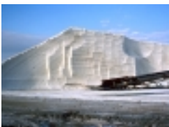
Table saunante avant la récolte du sel avec, au premier plan, un canal d'alimentation.