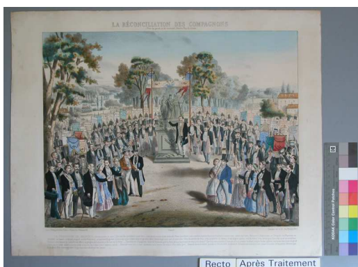
Recto après traitement