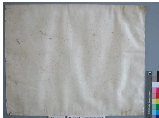
Verso avant traitement