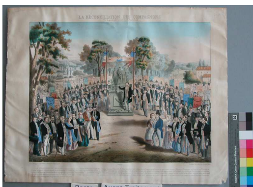
Recto avant traitement