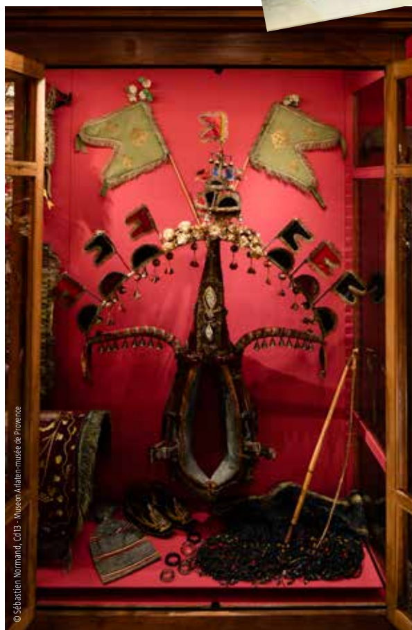
© Sébastien Normand, C013 - Muséon Arlaten-musée de Provence