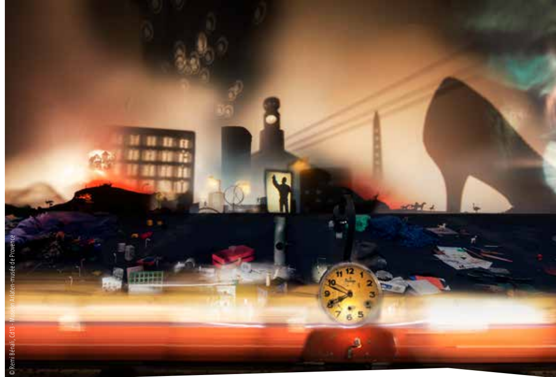
© Remi Béraldi, C013 - Museon Arlaten - musée de Provence

Le "Cercle Arts-Sciences en Camargue" est une plateforme coopérative à l'origine de projets croisant connaissances scientifiques et créations artistiques. Il réunit Le Citron Jaune-CNAREP, le Musée départemental Arles Antique, le Museon Arlaten, la Tour du Valat et le Parc naturel régional de Camargue.