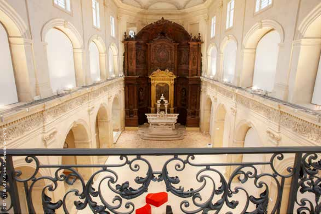
© Raim Béraly, Côté - Museon Arlaten, musée de Provence